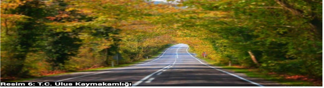
Resim 6: T.C. Ulus Kaymakamlığı

Ulus İlçesi'nde sınırları içerisinde bulunan Doğal Anıt Ağaç Tüneli ve çevresinde henüz gün yüzüne çıkarılmamış tarihi değerler hem turistik bir cazibe merkezi hem de ekoturizm odaklı bir destinasyon olarak önemli bir potansiyele sahiptir. Bu bağlamda tarihi değerlere yönelik arkeolojik kazıların tamamlanması gerekmektedir. Ayrıca tünelin korunması ve geliştirilmesi için aşağıdaki önerilerin hayata geçirilmesinde yarar bulunmaktadır: