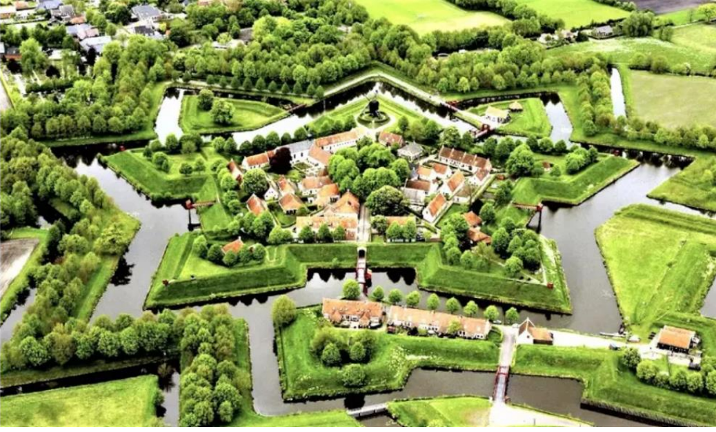
Şekil 1. Bourtange Kalesi