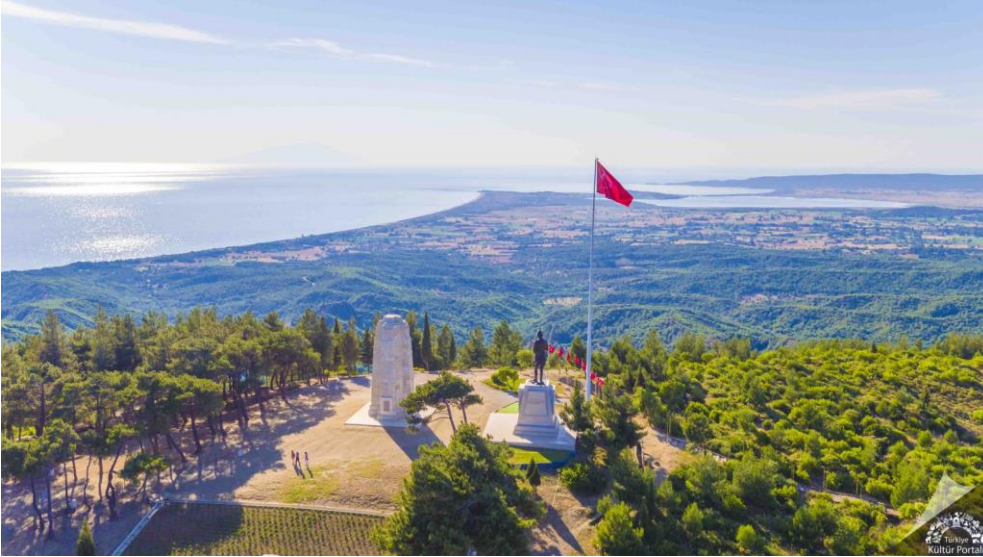
Şekil 2. Conkbayırı Muharebe Alanı Tarihi Kırsal Peyzajı

ICOMOS sınıflandırmasından hareketle ele alındığında savaşların gerçekleştiği alanlar ve diğer kırsal peyzaj alanları da tarihi kırsal peyzaj sınıfı içerisinde değerlendirilebilir. Günümüzde pek çoğu doğal/milli park olarak kabul edilen savaş alanları, gerek üzerindeki yapılar, gerekse günümüzde devam eden doğal çeşitlilikleri bağlamında ele alınmaktadır. Tamamı kırsal bölgede kalan bu peyzaj alanlarında estetik unsurlar değil daha çok tarihi unsurlar ön plana çıkmaktadır. Doğanın fiziksel yapısında yararlanılarak oluşturulmuş siper alanları, saldırı ve savunma noktaları, askeri tahkim bölgeleri gibi yapıları içermesinin yanında savaşlar açısından kimi önemli olayın gerçekleştiği yerleri de bünyesinde barındırmaktadır. Dünyada ki birçok örneği içerisinde Çanakkale Gelibolu Savaşlarının kanlı çatışmalarının yaşandığı “Conkbayırı Muharebe Alanı” tarihi, kırsal peyzaj olarak savaş alanı peyzajına önemli yere sahiptir.