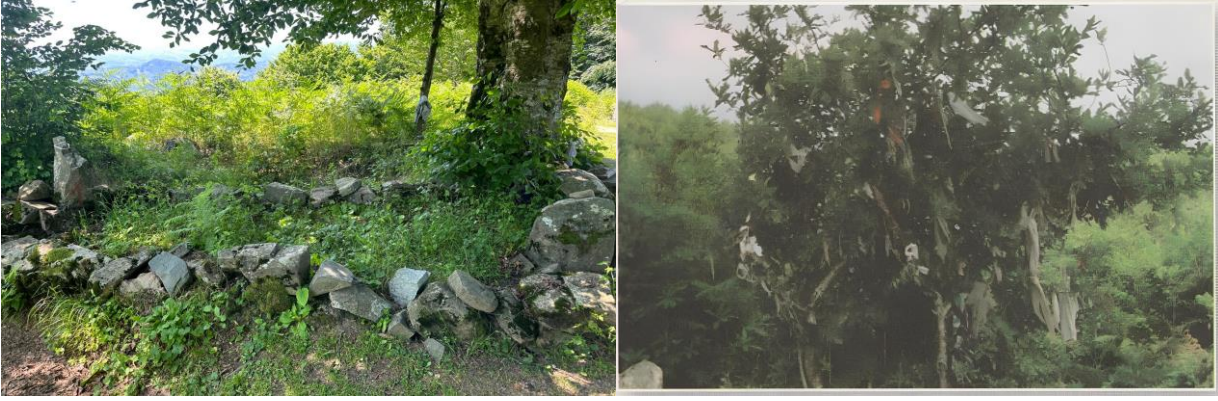
Resim 2. 1-Akıncı Evliyası, 2-Akıncı Evliyası çaput bağlanan ağaç (Sayılır, 2021).

Ahşap Çatak Köprüsü: Güllü deresinin üzerine kurulu olan ahşap köprünün kim tarafından yapıldığı bilinmemekle birlikte sözlü tarihte 150 yıllık olduğu belirtilmektedir (Tali, 2019).