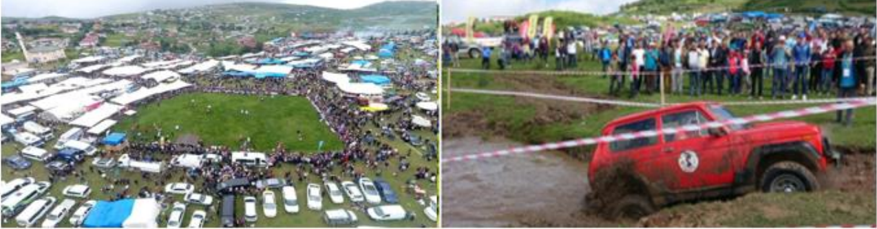
Resim 6: 1-Korgan Yaylası Festivali, 2-Korgan Off road şenlikleri

elektrik ve su altyapısı ile yemek yenilecek tesis bulunmaktadır. Korgan yaylaları içerisinde en yoğun yerleşim alanına sahip olan yayla 1560 metre rakımındadır. Yaylada ayrıca şenliklerin organize edildiği festival alanı içerisinde belediye sosyal tesisi, pazar yeri, yürüyüş parkurları, off-road ve motorkros yarış parkuru, kamelyalar ve bir adet göl bulunmaktadır. Diğer Korgan yaylalarında olduğu gibi Korgan Yaylasında da Mayıs ayında çiçek veren sarı ve mor ormangülleri çok muhteşem görünüm sunarken muhteşem mis bir koku yaymaktadır (Ordu İli Doğa Turizmi Master Planı 2013-2023, 2012).