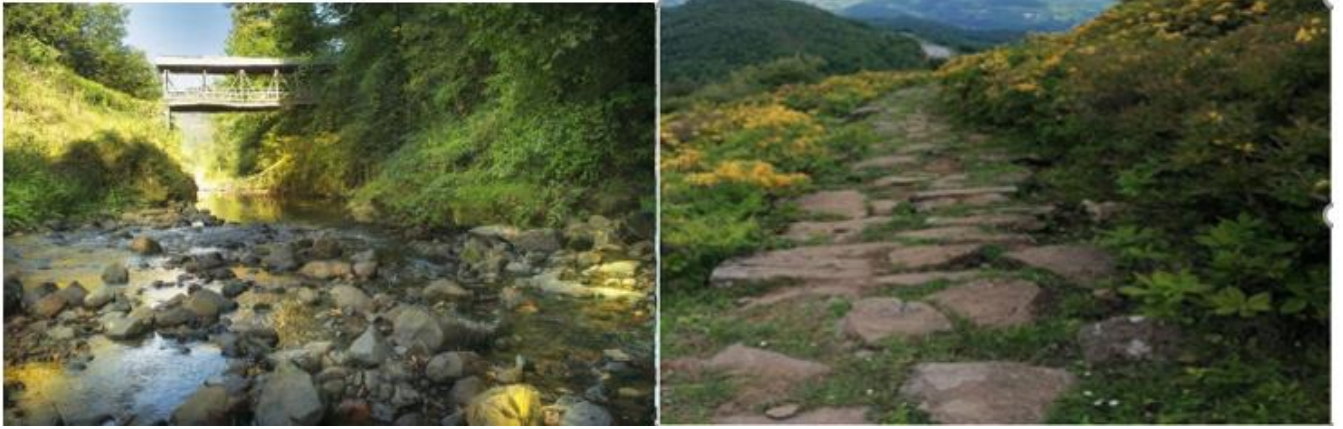
Resim 3: 1-Çatak Köprüsü, 2- Apsut Yaylası Antik Yol (foto:İlyas Adaş)

Apsut Yaylası Antik Yol: 2000 yılında bölgeye yapılan yüzey araştırmasında, yolun Roma dönemine Niksarı karadenize bağlayan antik yol olma ihtimalin yüksek olduğu ileri sürülmüştür (Özsait, 2002). Antik yol ile kalıntılar defneciler, yol çalışmaları ve hava şartları nedeniyle tahrip olduğu gözlemlenmektedir. Ancak yine de var olan kalıntıları yerel turistler tarafından ziyaret edilmektedir.