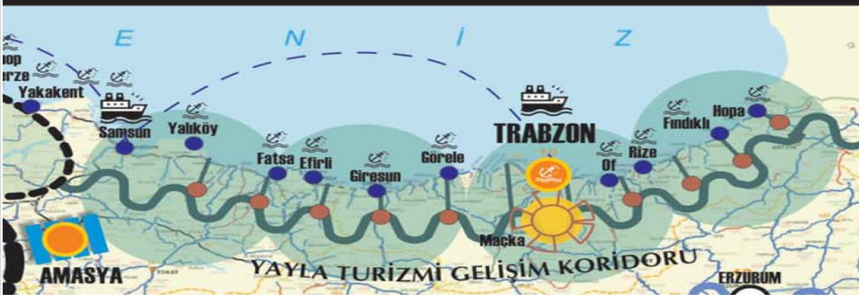
Şekil 2. Yayla turizmi gelişim koridoru