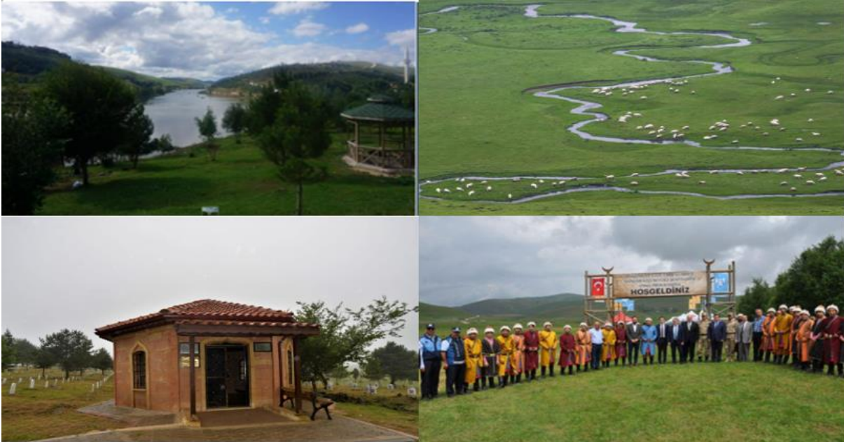
Resim 5: 1-Perşembe Yaylası ve Göleti, 2-Perşembe Yaylası Menderesleri 3-Emir Kümbet Türbesi 4-Emir Kümbet Anma Töreni

Emir Kümbet Türbesi: Ordu ilinde Danişmentli'lerin Bizans yönetimi altındaki Trabzonlularla olan mücadelelerine yönelik birçok kanıt bulunmaktadır. Perşembe yaylasındaki Emir Kümbet Türbesi, Akkuş ilçesindeki Melik Mehmet Gazi Türbesi, Çaybaşı ilçesindeki Yağıbasan Evliyası (Bayhan, 2023), Korgan ilçesi Emir Yakup Türbesi (Adaş, 2020) ve Akıncı Evliyası (korgan.meb.gov.tr/) bilinen kültürel değerler arasında yer almaktadır. Emir Kümbet türbesi, Karadeniz bölgesini fetih etmek amacıyla Niksar'ı başkent yapan Danişment Gazinin, Rumlarla M.S. 1105 yılında yaptığı 2. Canik savaşının geçtiği Perşembe yaylasında yer almaktadır. Savaş sonrasında Danişment Gazi ağır yaralı olarak Niksara geri döner ve orada vefat eder (Demir, 2012). Perşembe yaylasında türbesi olan kişinin ise Danişment gazinin oğlu İsmail olduğu ileri sürülmektedir (Adaş, 2020). Bugün, Emir kümbet ve şehitlerinin hatıralarını yaşatmak için anma programları düzenlenmektedir.