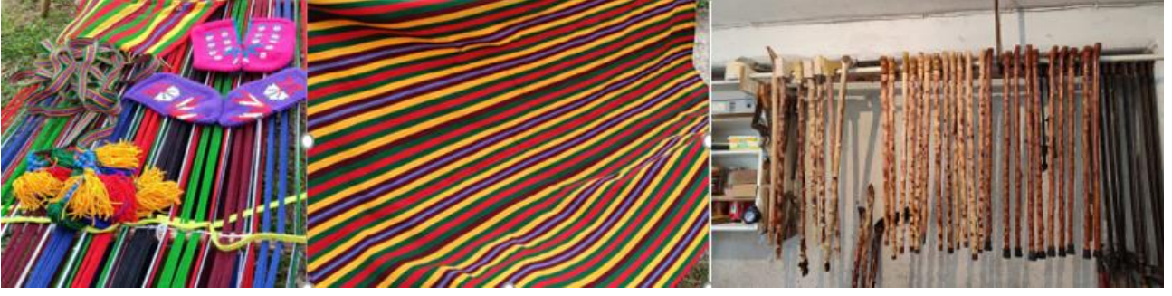
Resim 4: 1-2 Dastar Dokuma Kolan ve Kilim, 3-Baston