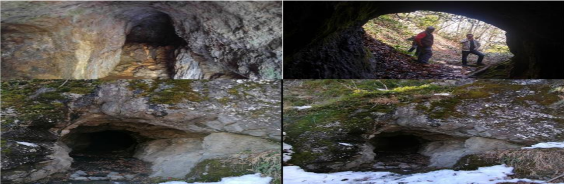
Resim 9: 1 ve 2-Tatarcık Mağarası, 3 ve 4- Karakoyunlu Mağarası

Mağaralar: Mağaralar doğal yollardan oluşabileceği gibi insan eliyle de meydana getirilebilir. Mağaralar sahip oldukları değerler açısından kültürel ya da doğal özelliklerine göre turistler tarafından bilimsel, sağlık, rekreasyonel, estetik, kültürel, sportif ve macera amacı ile ziyaret edilebilmektedir (Yozcu, 2020:46). Korgan ilçesinde keşfedilmeyi bekleyen Tatarcık ve Karakoyunlu adı altında iki adet mağara bulunmaktadır. Tatarcık mağarası, Korgan ilçesinin tarihini Halipler kavmine kadar dayandırması açısından önemlidir. Çünkü Korgan ilçesini tarihi ile ilgili yapılan çalışmalarda, Tatarcık mağarasında demir madeni çıkarıldığı ve madenin işletilme zamanının Halipler dönemi olduğu sözlü tarihte sıklıkla dile getirilmektedir (Bolgi, 2014). Ayrıca, Karakoyunlu mahallesinde, insan eliyle oluşturulmuş eski dönemlere mağara bulunmaktadır. Gerek Tatarcık mağarası, gerekse de Karakoyunlu mağarasının uzmanlar tarafından araştırılıp tarihinin ortaya çıkarılması turizme kazandırılması açısından önemlidir.