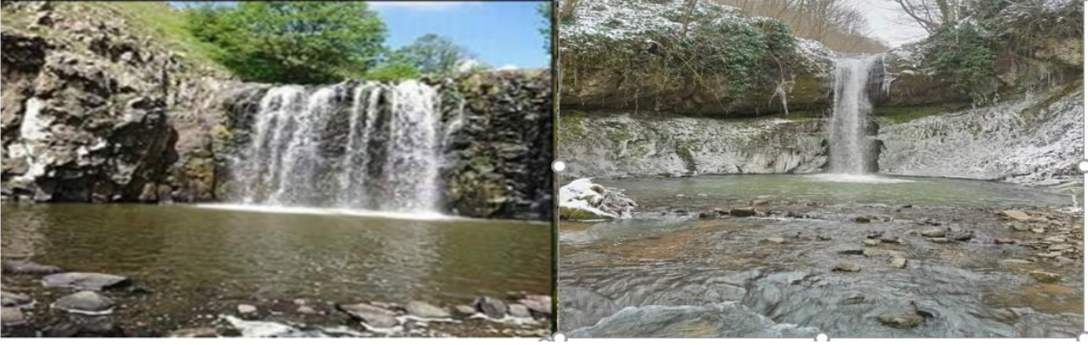
Resim 8: 1-Çiseli Şalelesi 2-Gillik Şalelesi

Mağaralar: Mağaralar doğal yollardan oluşabileceği gibi insan eliyle de meydana getirilebilir. Mağaralar sahip oldukları değerler açısından kültürel ya da doğal özelliklerine göre turistler tarafından bilimsel, sağlık, rekreasyonel, estetik, kültürel, sportif ve macera amacı ile ziyaret edilebilmektedir (Yozcu, 2020:46). Korgan ilçesinde keşfedilmeyi bekleyen Tatarcık ve Karakoyunlu adı altında iki adet mağara bulunmaktadır. Tatarcık mağarası, Korgan ilçesinin tarihini Halipler kavmine kadar dayandırması açısından önemlidir. Çünkü Korgan ilçesini tarihi ile ilgili yapılan çalışmalarda, Tatarcık mağarasında demir madeni çıkarıldığı ve madenin işletilme zamanının Halipler dönemi olduğu sözlü tarihte sıklıkla dile getirilmektedir (Bolgi, 2014). Ayrıca, Karakoyunlu mahallesinde, insan eliyle oluşturulmuş eski dönemlere mağara bulunmaktadır. Gerek Tatarcık mağarası, gerekse de Karakoyunlu mağarasının uzmanlar tarafından araştırılıp tarihinin ortaya çıkarılması turizme kazandırılması açısından önemlidir.