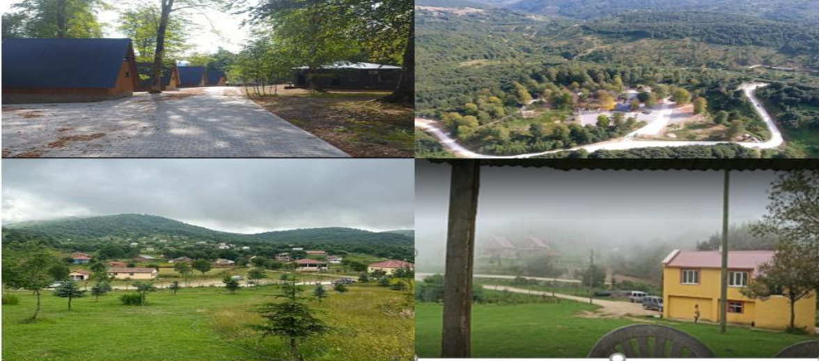
Resim 7: 1-İten İçi Mesire alanı, 2-Yeşil yol projesine dahil olan Aytepe Delmece Yaylası ve İteniçi Balık Çiftliği

İten İçi Mesire Yeri: İlçeye uzaklığı 25 km olan mesire alanı ağırlıklı olarak gürgen ağaçlarından oluşan ormanlık bir alandır. Mesire alanında bir adet 10 bungalov evlerden meydana gelen turizm işletme belgeli tesisi yer almaktadır (ordu.ktb.gov.tr, erişim tarihi 15.12.2023). Mesire alanında ayrıca, kır lokantası, WC, yürüyüş alanları mevcuttur. Perşembe yaylası ile Korgan yaylası arasında konumlanan İteniçi mesire alanı, DOKAP BKİ tarafından desteklenen yeşil yol projesinin güzergâhı içerisinde bulunmaktadır.