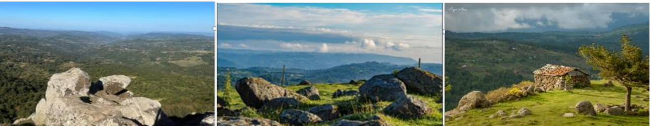
Resim 10: 1-Yalman Tepesi, 2-Apsut Yaylası Kayalıkları, 3-Apsut Yaylası

İklim özellikleri açısından Karadeniz ikliminin niteliklerini taşıyan Korgan ilçesinden yeryüzü ormanlık alan, fındık tarlaları ve yeşil çayırarla kaplı olup kayalık alanlar sınırlı sayıdadır. Diğer taraftan çevresindeki alanlara oranla daha yüksek olan Yalman tepesi, Aytepesi, Başalan mevki, Faltaşı kayalık bölgesi, Apsut yaylası seyir terası kurulma potansiyeli olan yerler arasında sayılabilir.