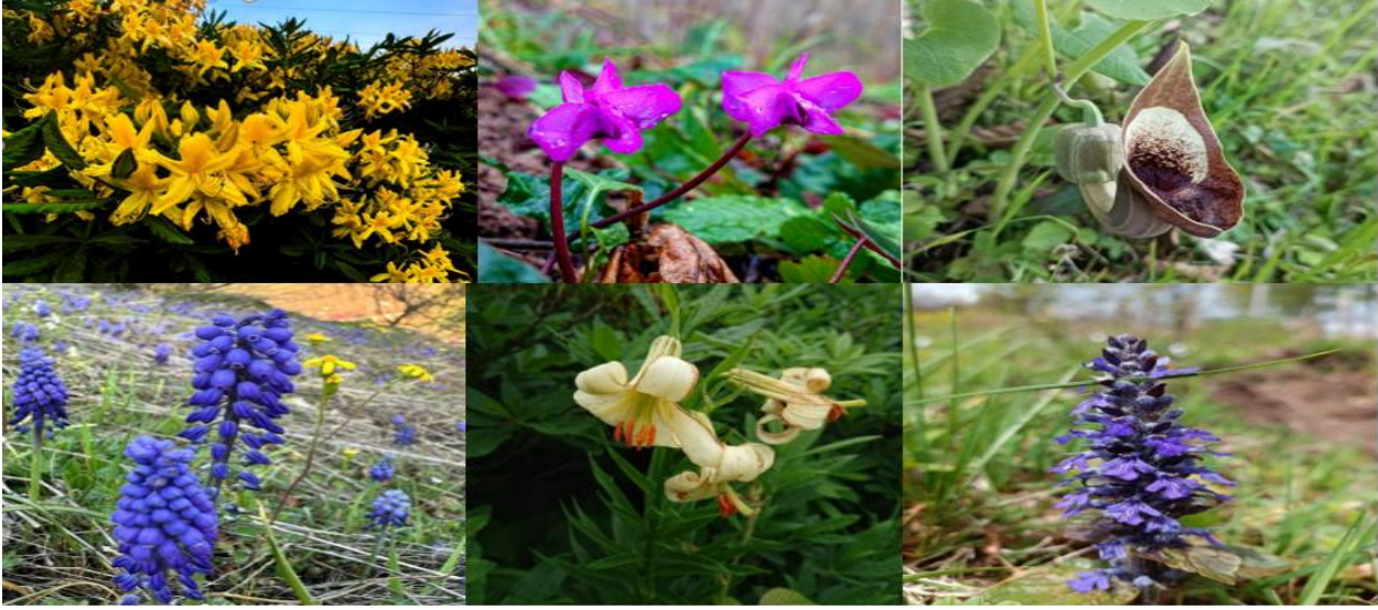
Resim 11: 1- Sarı çiçekli Orman Gülü (Rhododendron Luteum), 2-Sıklemen çiçeği (Cyclamen coum), 3- Lohusa otu (Aristolachiaceae), 4- Dağ sümbülü (Muscari neglectum), 5-Akkuş Zambağı (Lilium akkusianum), 6-Çayır mayasılı (Ajuga genevensis)

gözlemlenmektedir. Gıda olarak yemeklerde kullanılan Hoşgıran, Baldıran, Nünük, Kabalak, Kalduruk, Merülcan, Kantoran, Sırgan, Sinirotu bunlar arasında sayılabilir (Sarıkaya ve Karaevli, 2019). Ayrıca, Yayla arazisi ve Ormanlık alanları bulunan ilçe de yayla ve orman altı çiçekleri bulunduğu gözlemlenmiştir. Özellikle Mayıs ve Haziran aylarında tüm yaylaları kaplayan sarı orman gülleri görsel bir şölen sunarken botanik turizm açısından önemli bir potansiyel taşımaktadır. Bitki çeşitliliği ile ilgili envanter çıkarılması ve gezi rotaları oluşturulması bu potansiyelin açığa çıkarılmasına önemli bir katkı sunacaktır.